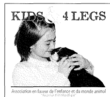
Association en faveur de l'enfance et du monde animal